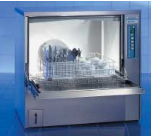
Pour assiettes, plats et couverts

+++ combi-é lave-ustensiles/lave-vaisselle GSR 36 +++