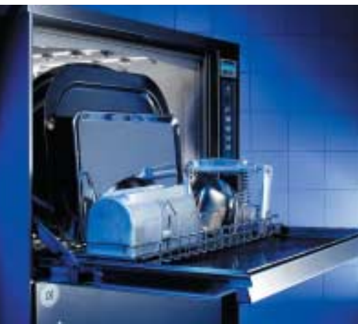
Grande hauteur de passage pour ustensiles encombrants