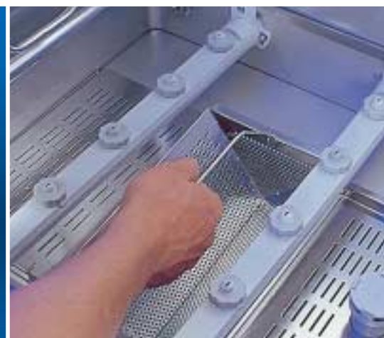
Impossibilité aux grosses impuretés de parvenir dans le bain lessiviel