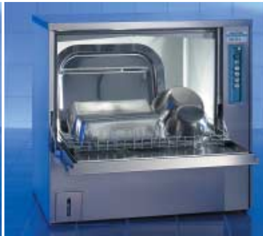
Pour ustensiles utilisés dans le magasin