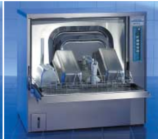
Pour ustensiles utilisés dans le laboratoire