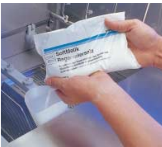
Traitement de l'eau intégré, à titre d'option