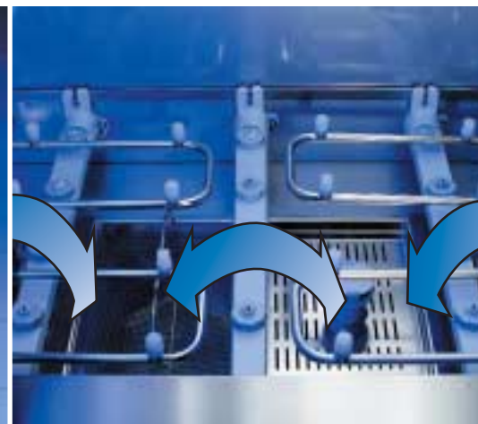
Grande force de lavage, système de lavage à bras oscillants