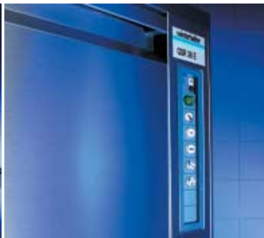
Commande simple, affichage clair